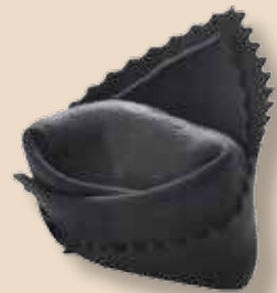
Giganti al Salmone