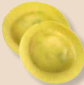
Pensieri del Diavolo