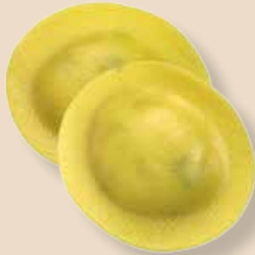
Pensieri del Diavolo